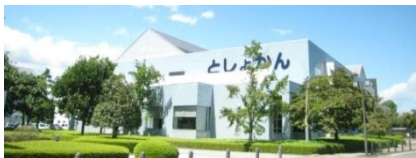
黒川沿いから見える図書館↑