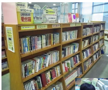
中高生からのおすすめボードがあるYAコーナー↑