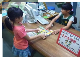
夏休みのイベントの子ども司書→