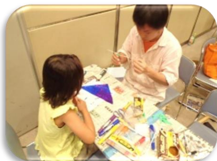
プラスチックたけとんぼ工作