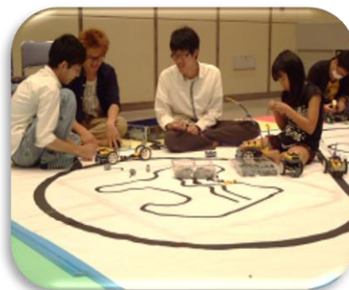
レゴロボット教室