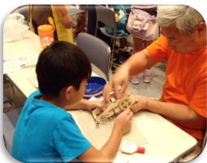
アイデアカー工作